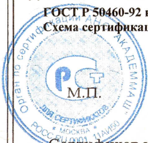
Схема сертификации З.

ГОСТ Р 50460-92 наносится на корпус изделия и (или) в эксплуатационную документацию